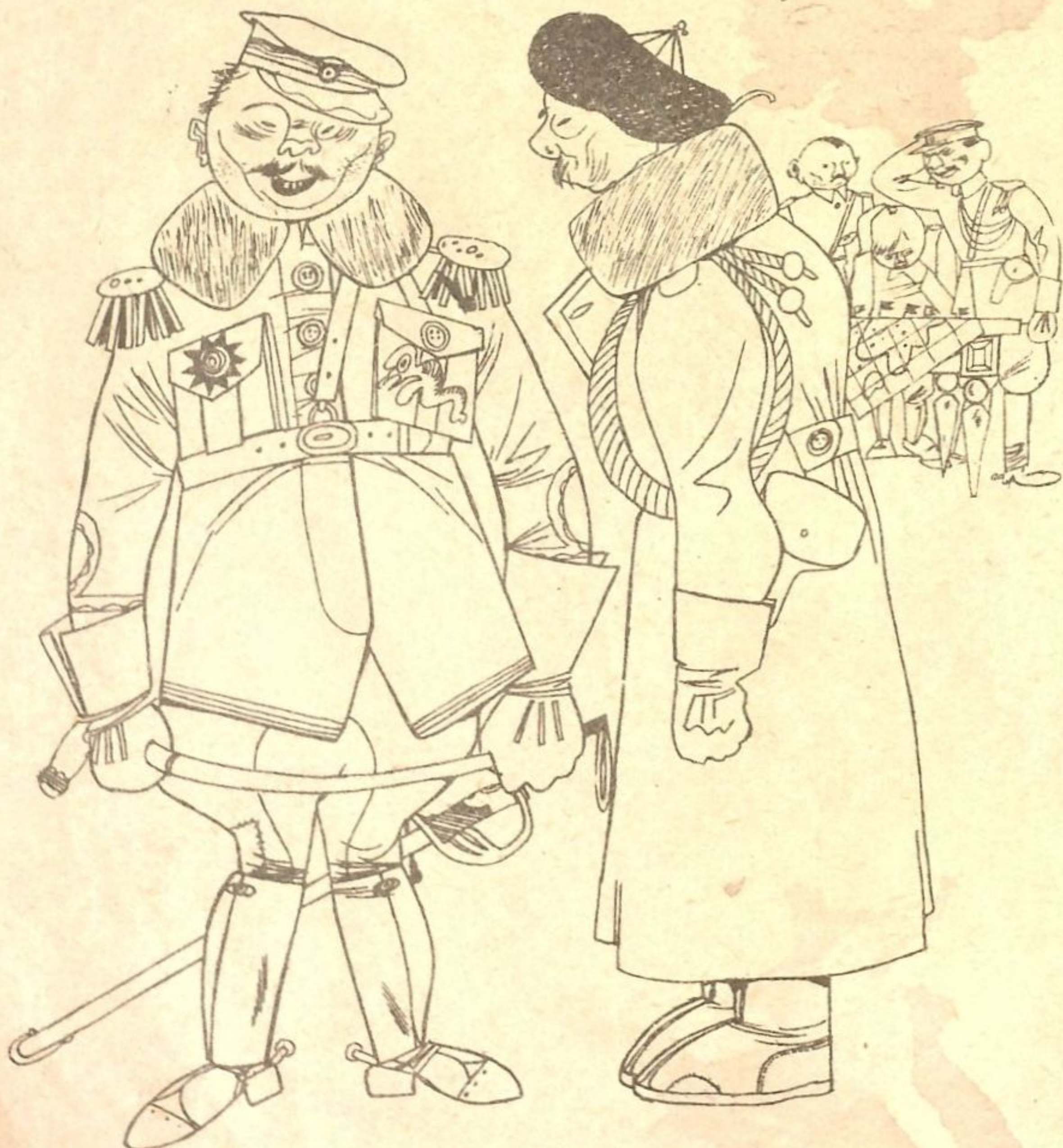
Рис. Ю. Г.

ЧЖАН-ЦЗО-ЛИН: —Кантонцы заняли у меня район в пятьдесят деревень. Но и я тоже не дурак! Я занял у Англии пятьдесят миллионов. И занял прочно, без отдачи!