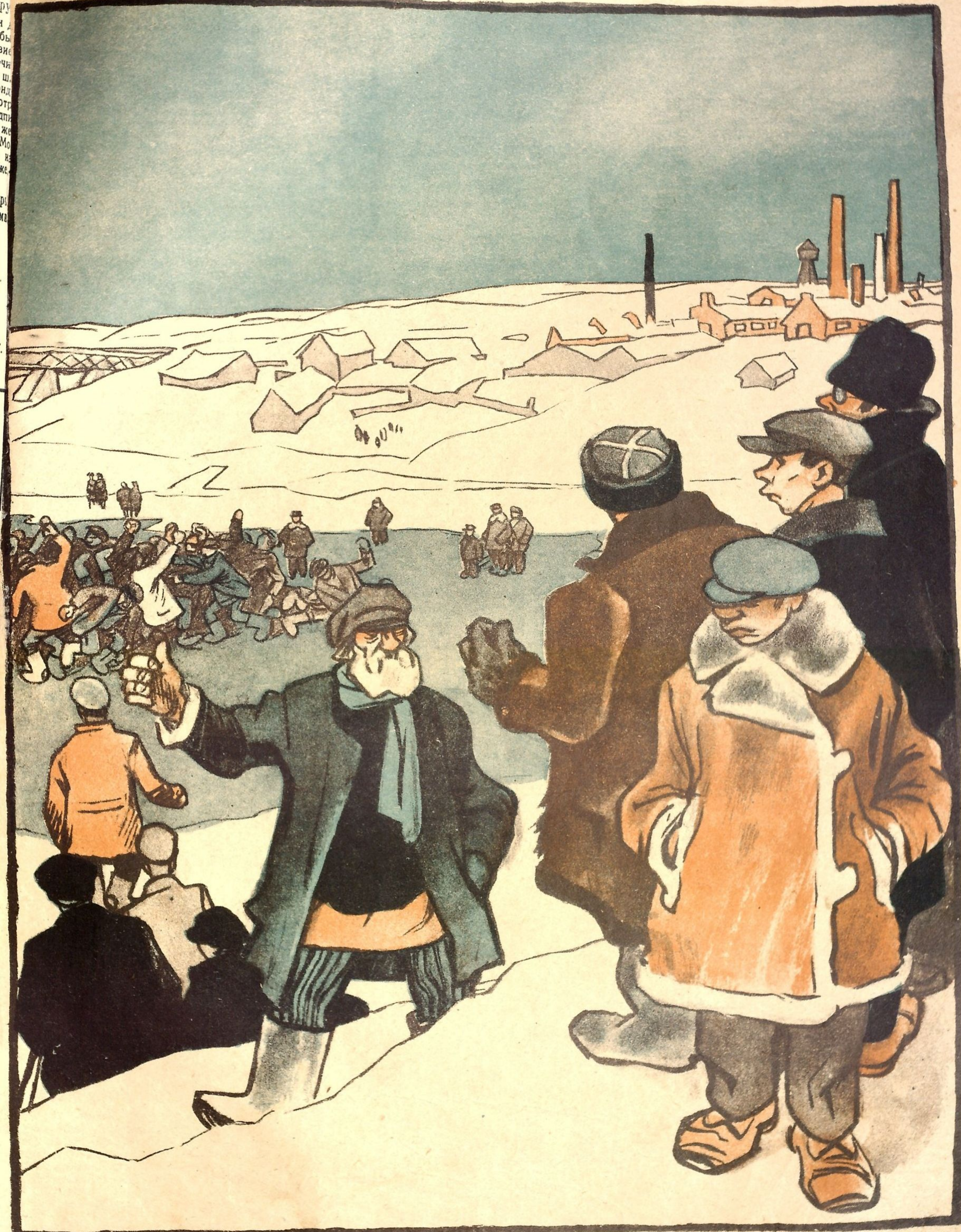
Рис. Ив. Малютина

КУЛЬТПРОСВЕТИТЕЛЬ: — До чего темный народ! Мы им сегодня пять докладов организовали, — а они ишь какое дикое занятие нашли! Чем это объяснить?