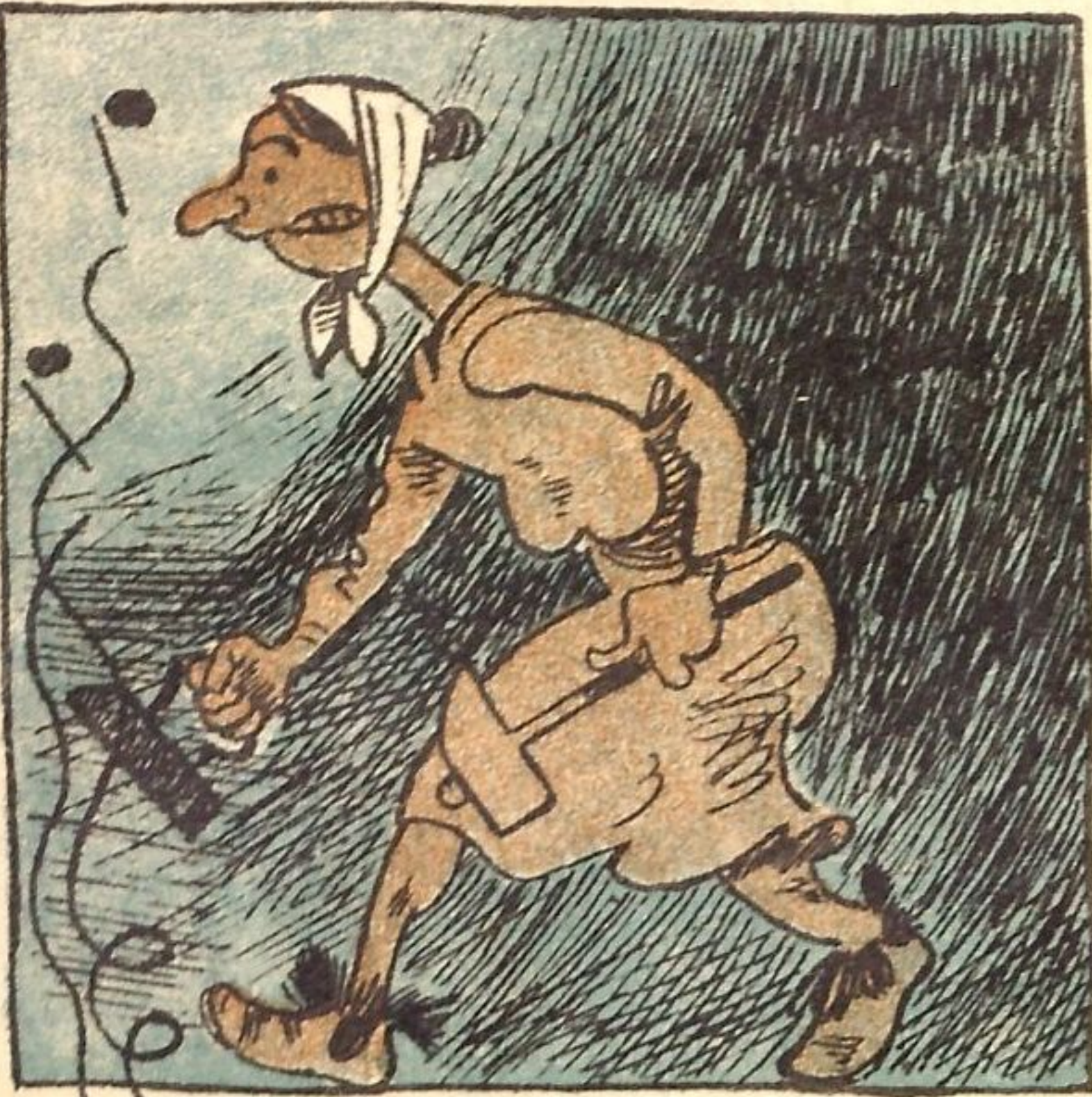
Рис. К. Ротова