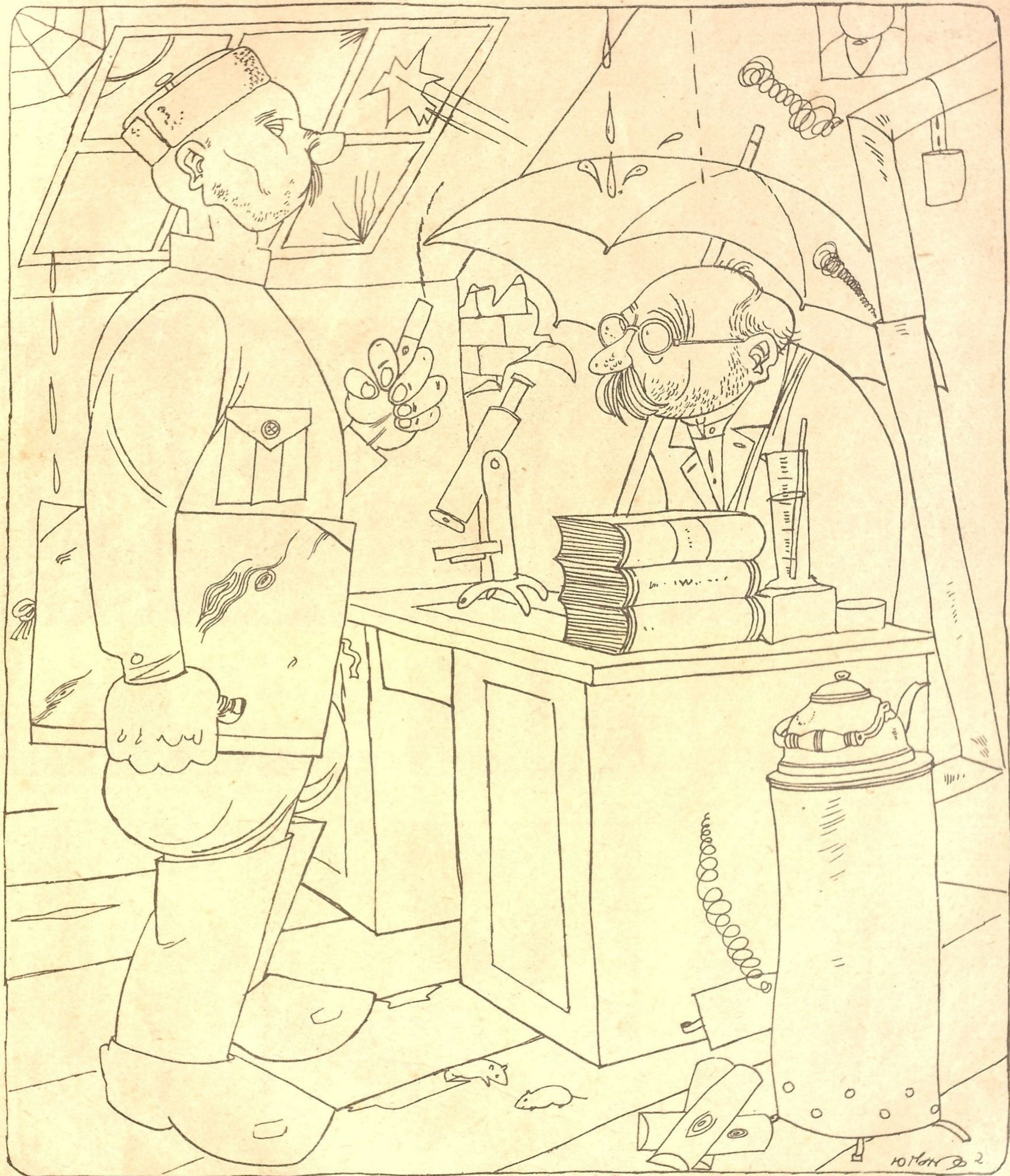
Рис. Ю. Ганфа

УЧЕНЫЙ: — Товарищ управдом, вы бы хоть какие нибудь меры приняли. Ведь, жить невозможно! Течет, дует... УПРАВДОМ: — Многого вы хотите! Вам, выдающимся людям, и так вон какая льгота дадена: могилы ваши теперь охранять велено. А вы говорите—течет!