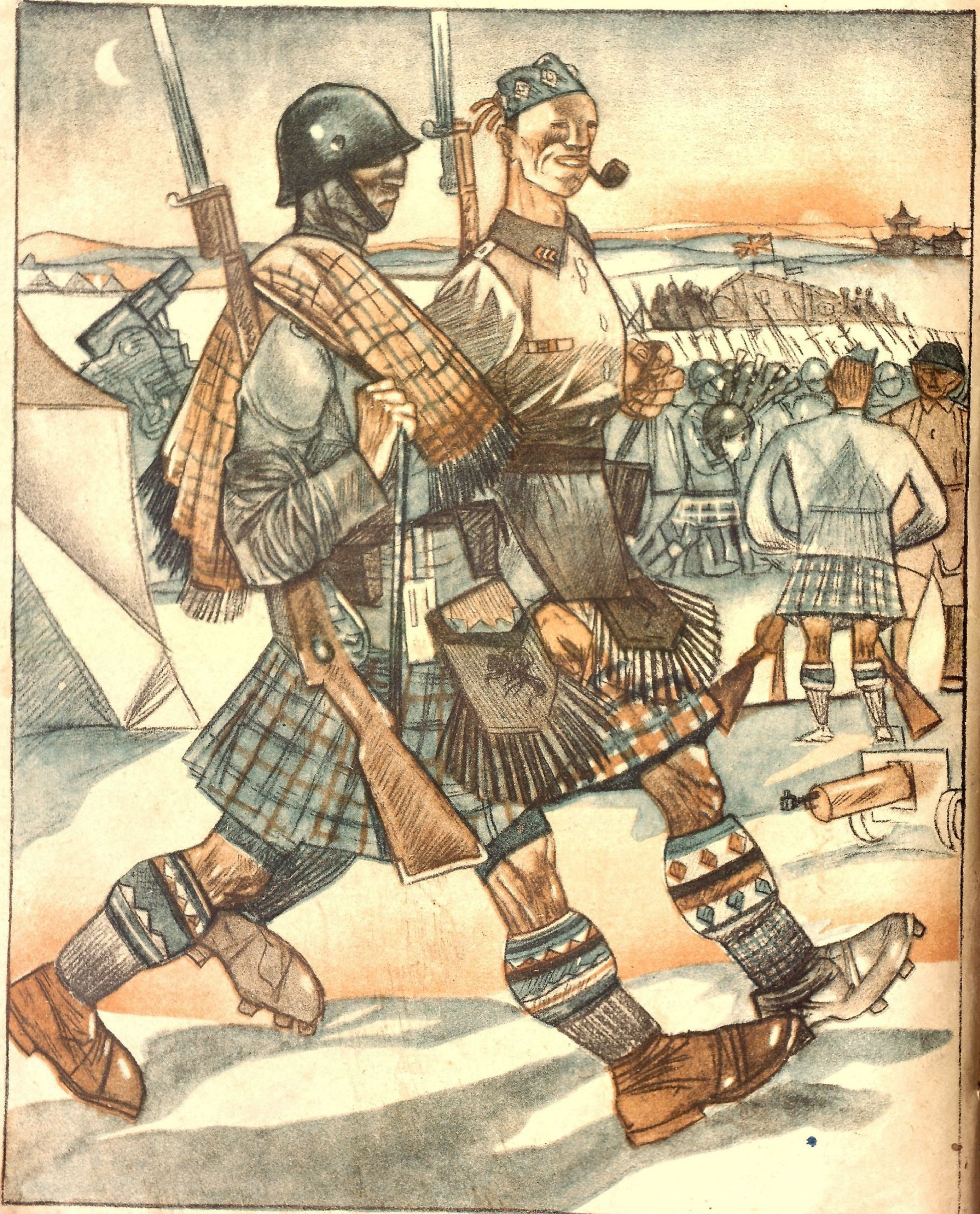
Рис. Ю. Ганфа